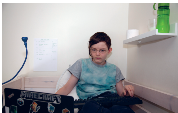
Der bliver chattet lidt når der er overskud