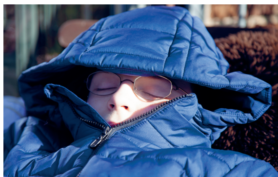
- derudover anbefaler lægen frisk luft