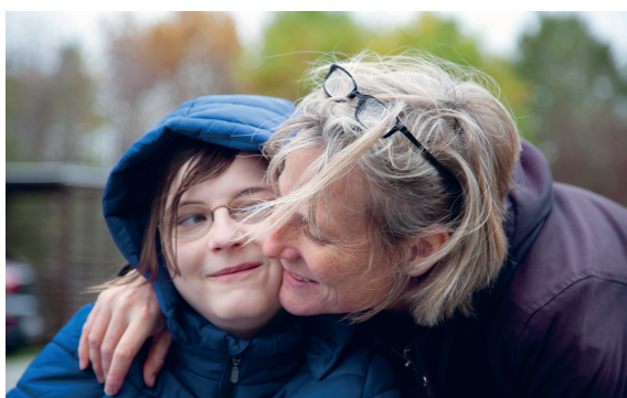
Et knus af en god mor